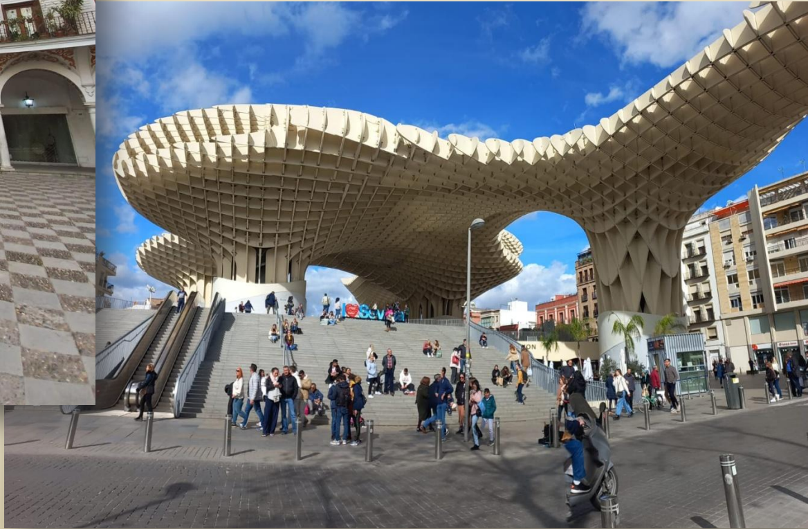
Metropol Parasol o Setas