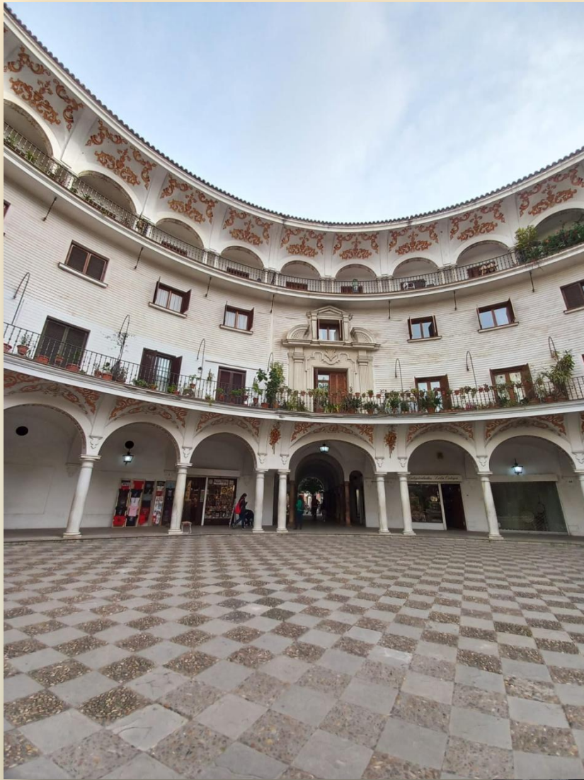
Piazza del Capildo